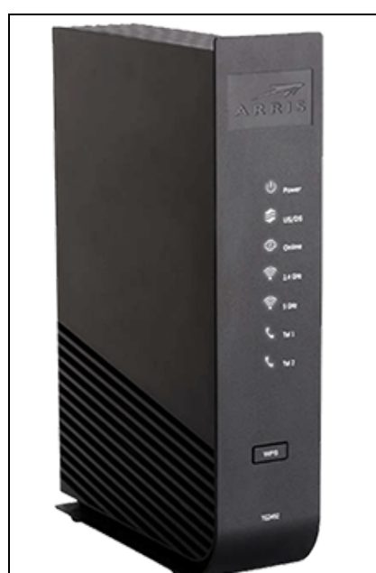
Arris TG 24925